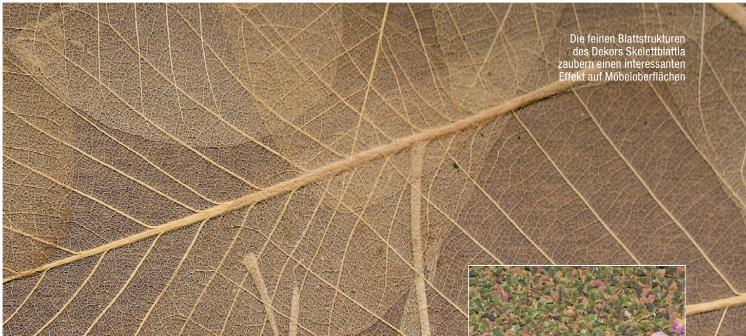
Die feinen Blattstrukturen des Dekors Skelettblatta zaubern einen interessanten Effekt auf Möbelerflächen