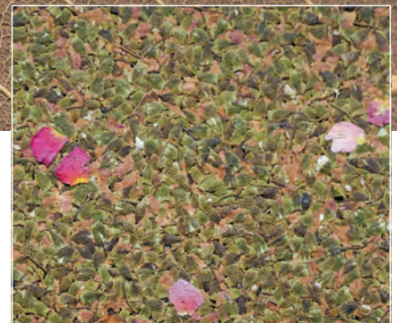
Auf Rosen gebettet: Möglich z. B. mit einem Betthaupt aus Organoid-Platten – zarter Rosenduft inklusive